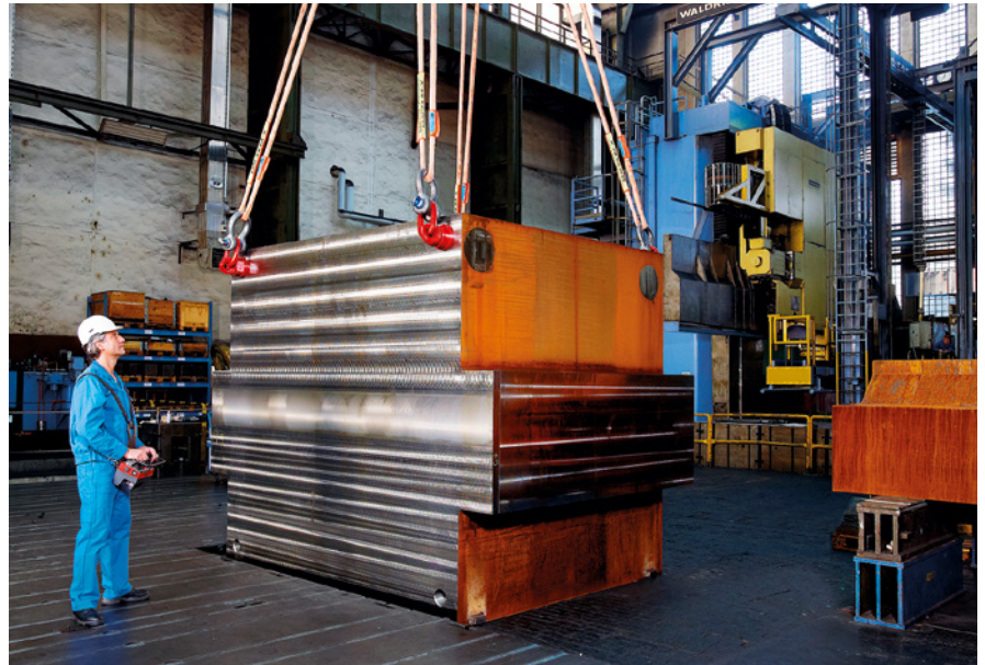
80 - 125 t mit gewebter Schutzhülle