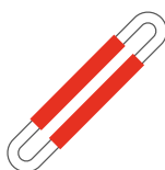
Anbringung nach Abb. 5

NoCut® sleeve - gewebter Schutzschlauch aus UHMPE. NoCut® pad, NoCut® bumper sowie