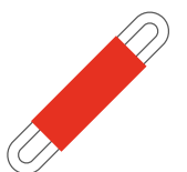
Anbringung nach Abb. 3