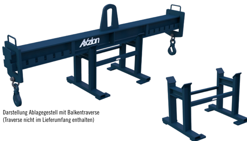
Darstellung Ablagegestell mit Balkentraverse (Traverse nicht im Lieferumfang enthalten)

BGR 500: Anschlag- und Lastaufnahmemittel müssen so abgestellt werden, dass sie nicht umkippen, herabfallen oder abgleiten können. Sorgen Sie vor und bestellen Sie das Ablagegestell passend zu Ihrer Traverse. Solide Profilstahlkonstruktion mit Montagepunkte zur Bodenbefestigung.