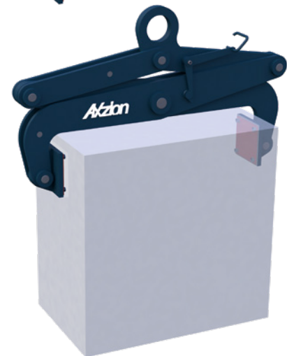
Blockgreifer mit Last