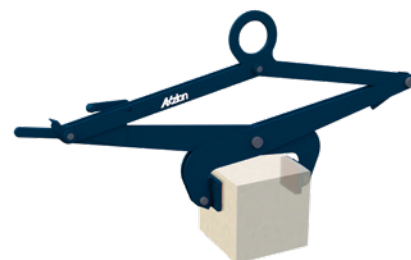
Blockgreifer mit großer Last