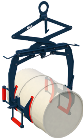
Fasswendezange mit gekippten Fass