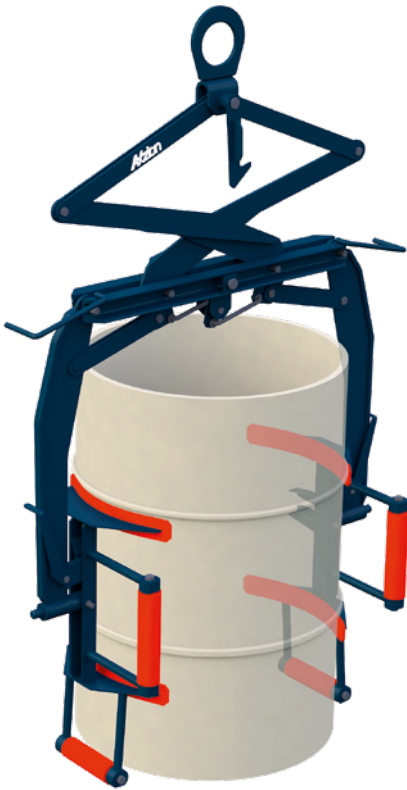
Fasswendezange mit aufrechtem Fass