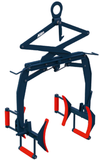
Fasswendezange ohne Fass