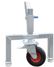
Mit Super-Elastik-Vollgummireifen Für den Innen- und Außenbereich.