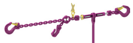
Montagebeispiel: ICE-Zurrkette mit Ratschenspanner und Verkürzungshaken

i Weitere ICE-Zurrkettenvarianten mit ICE-Multiverkürzungsklauen oder ICE-Verkürzungshaken sind möglich. Fragen Sie danach!