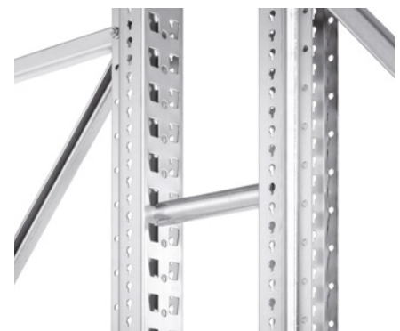
Distanzstück für Doppelregale

Weiteres Zubehör (z.B. Durchschubsicherungen, Rammschutz ...) ist auf Anfrage erhältlich!